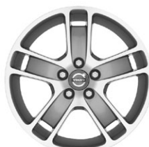
ZAURAK 17" diamantový řez