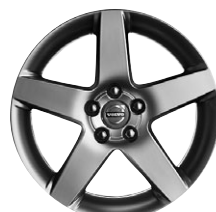
SERAPIS 17" pouze pro R-DESIGN