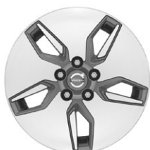
LIBRA 15" a 16" pouze pro DRIVE