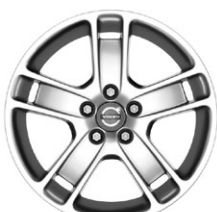
ZAURAK 17" chrom